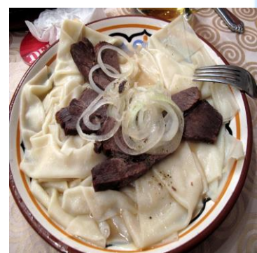
12rasm. Qaynatib pishirilgan go'shtli taomlar turi. Beshbarmoq va uning bezatilish turlari

Beshbarmoq - qaynatilgan go'sht va qaynatilgan xamir bo'laklaridan tayyorlanadigan taom. Go'sht bulyonda pishiriladi va ustiga piyoz hamda ziravorlar qo'shiladi. Bu taom Markaziy Osiyo xalqlarining an'anaviy taomlaridan biri hisoblanadi.