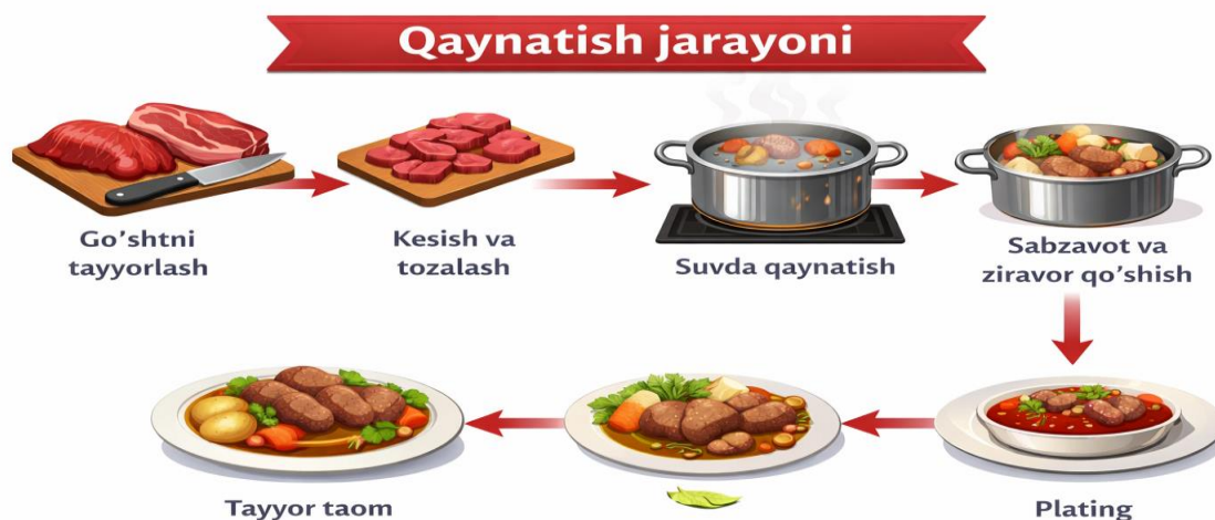
1-rasm. Taom qaynatish jarayoni bosqichlari